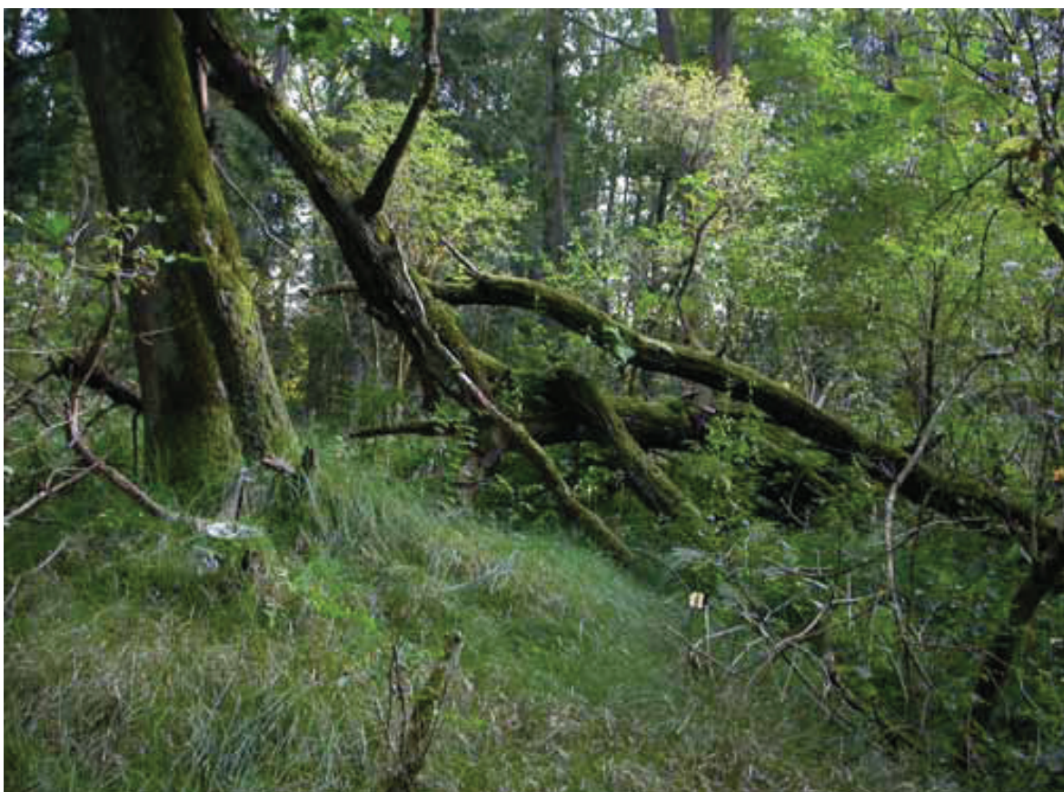
Obr. 1 – Přírodní rezervace Bažantnice u Pracejovic. Fig. 1 – Bažantnice u Pracejovic Nature Reserve.