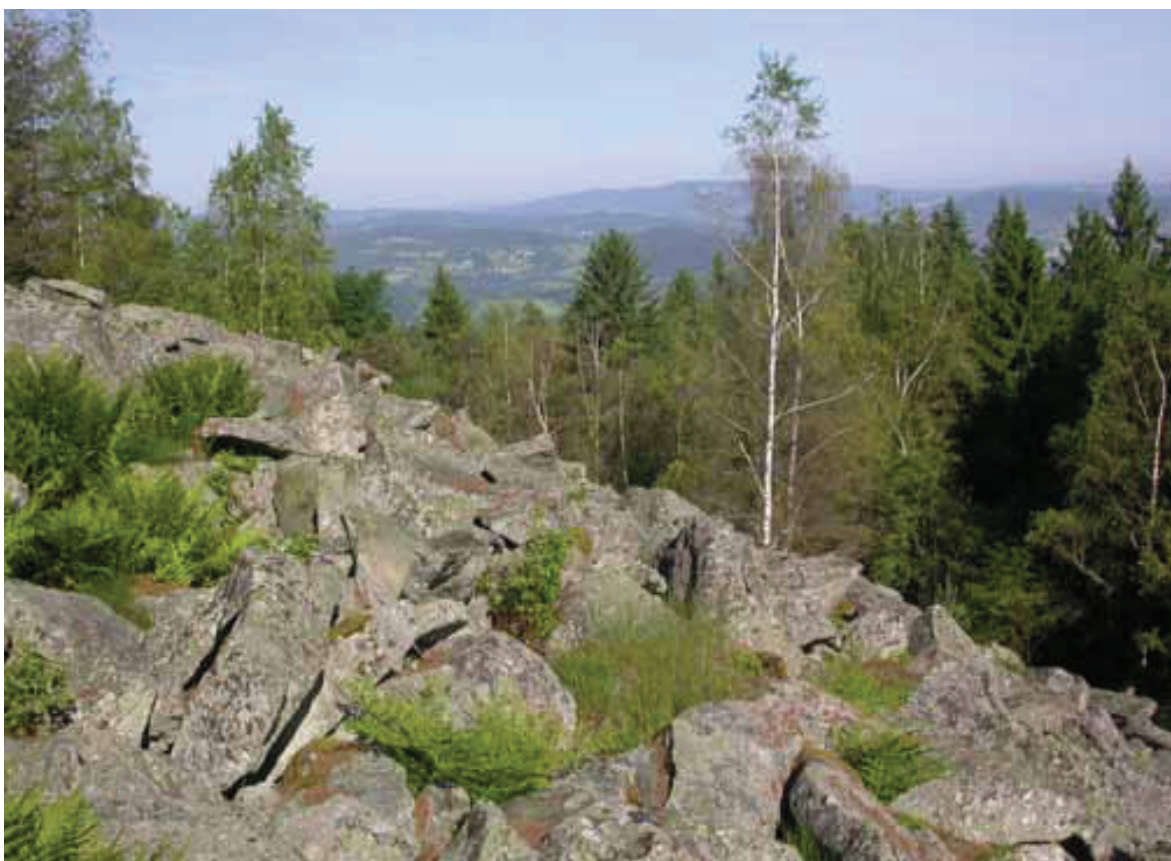
Obr. 2 – Přírodní památka Mařský vrch (foto J. Šumpich 2010). Fig. 2 – Mařský vrch Nature Monument (photo by J. Šumpich 2010).