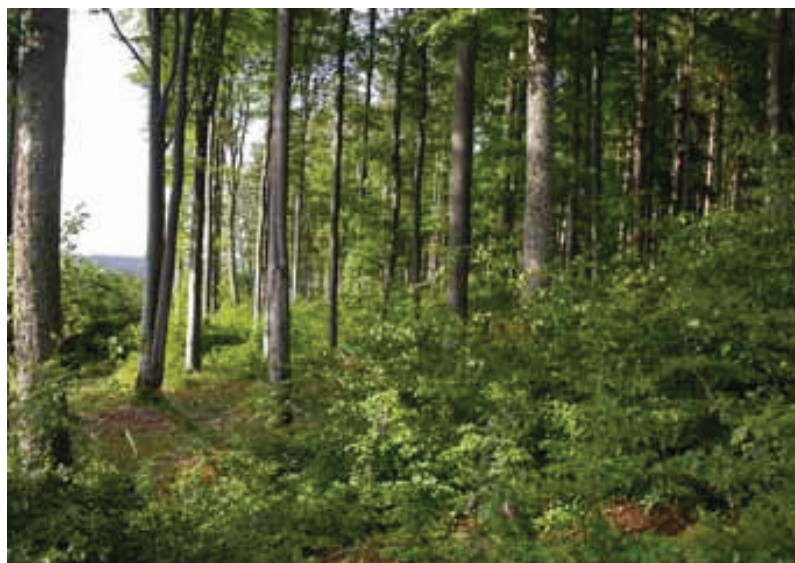
Obr. 5 – Přírodní rezervace Myslivna.

Fig. 4 – V polích Nature Monument.